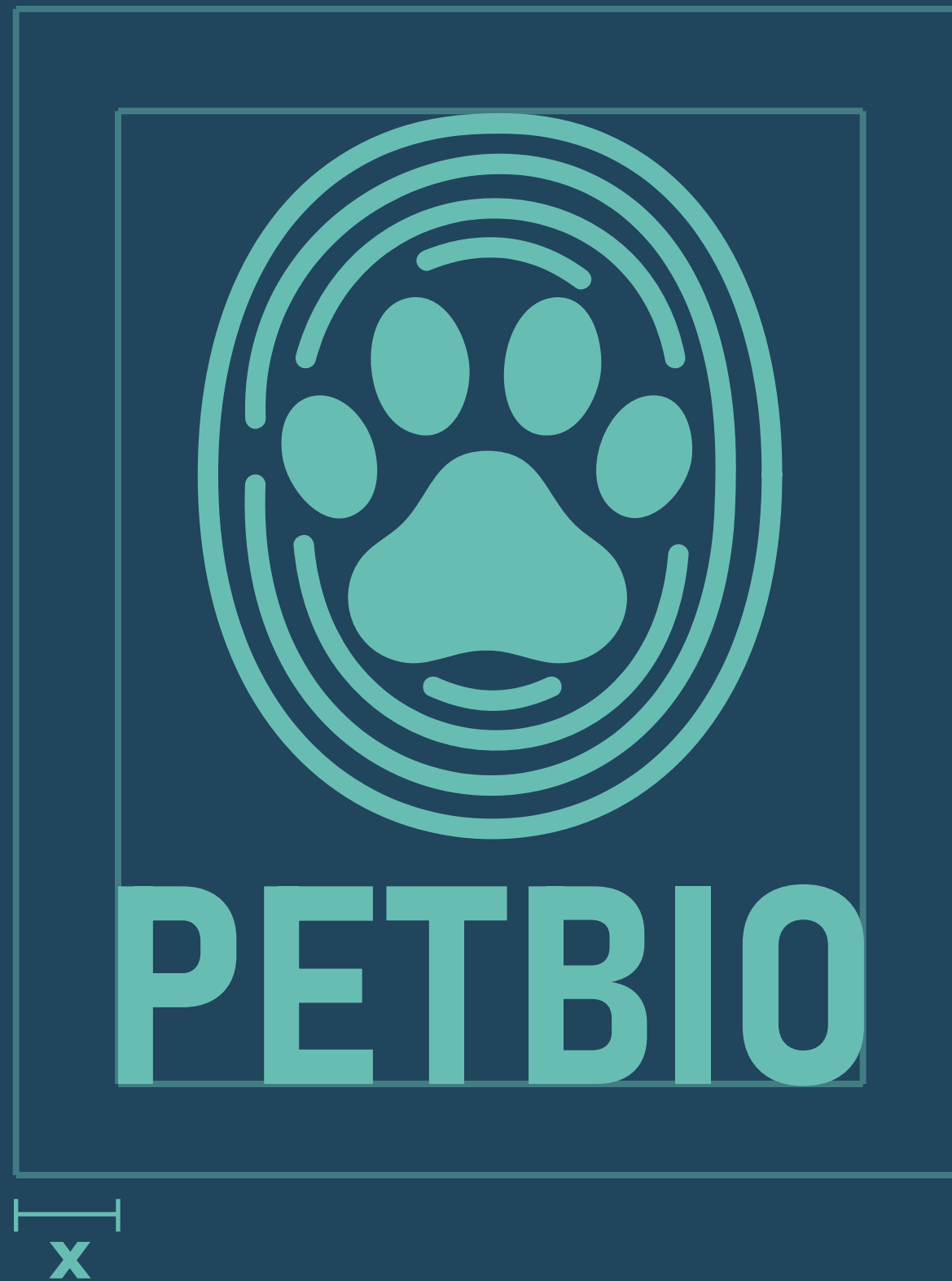
Zona de protección